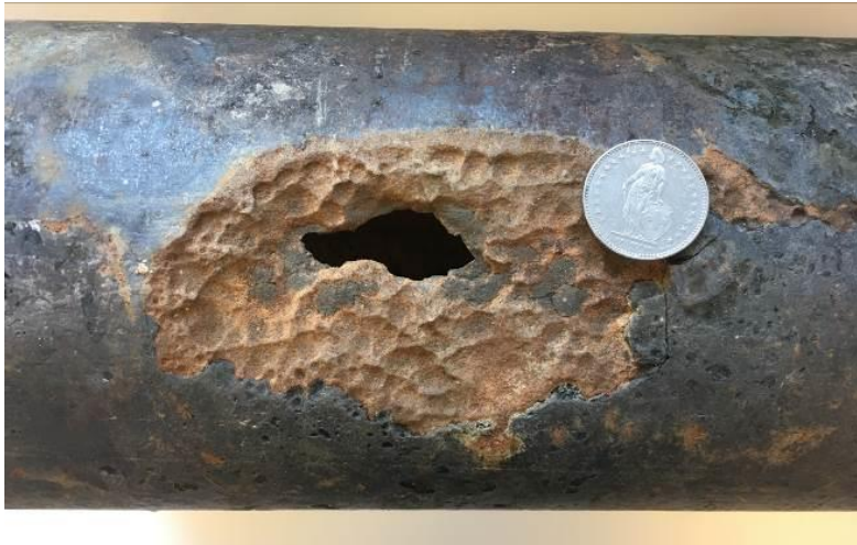
Fuite d'eau 2'700 litres/minute route de Champoz , détail du tuyau 14.05.2019

Les conduites privées seront également remplacées sur la longueur comprise entre la conduite communale et l'intérieur des parcelles privées.